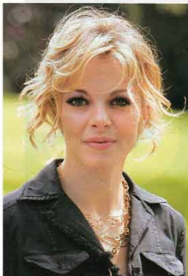
Claudia Gerini attrice

«Perdo tutto, orologi, cose preziose... Da due anni, però, porto sempre un anello con tre diamanti. Era un ciondolo che ho fatto modificare con l'idea di farne qualcosa di mio, una specie di fidanzamento con me stessa. È arrivato in un momento molto particolare della mia vita.»